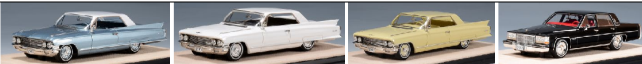
STM62601 Cadillac Coupe de Ville 1962 blau metallic