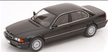
KKDC180366 BMW 740i E38 schwarzmetallic