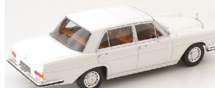
KKDC181212 Mercedes 300 SEL 6.3 W109 (1967-1972) weiß