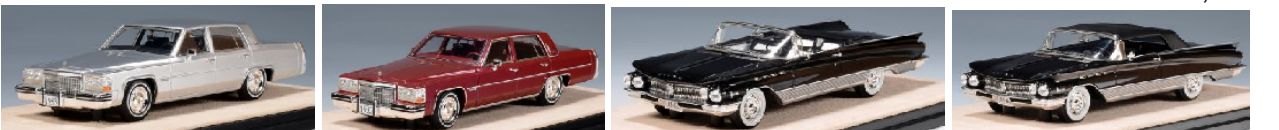
STM83502 Cadillac Sedan de Ville 1983 silber