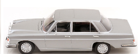
KKDC181213 Mercedes 300 SEL 6.3 W109 (1967-1972) silber metallic