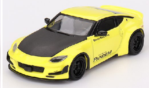
MGT00752-L Nissan Z 400 Pandem 2024 gelb