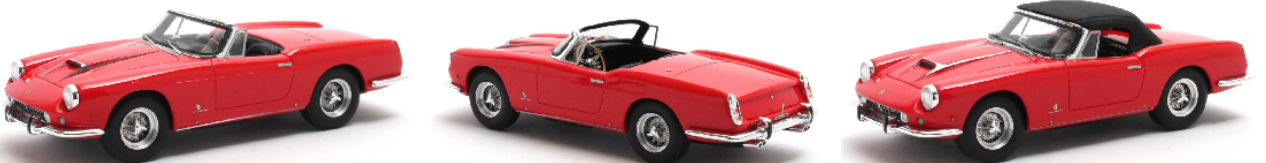
MX40604-043 Ferrari 400 Superamerica Pininfarina Cabriolet #1885SA 1960 rot