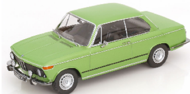
KKDC181141 BMW 2002L tii 2.Serie 1974 grünmetallic (eckige Rückleuchten)