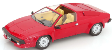
KKDC181281 Lamborghini Jalpa 3500 1982 rot