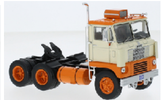
TR185 Dodge LCF CT 9000 (1960) weiß / blau € 35,95 TR186 Freightliner FLC 120 64 T (1977) schwarz € 35,95 TR187 Mack Superliner Magnum (1985) grau metallic € 35,95 TR188 White 7400 (1960) beige € 35,95