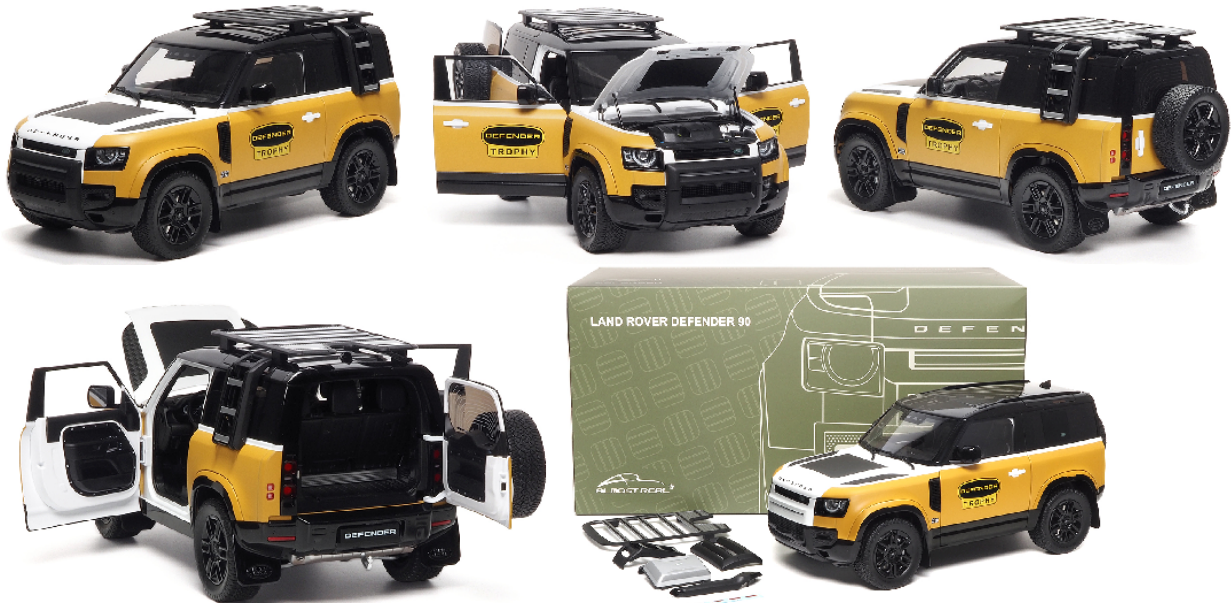
ALM810710 Land Rover Defender 90 (2023) Trophy Edition