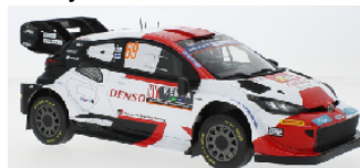
18RMC174A Toyota GR Yaris Rally1 Hybrid # 33 Finnland Rallye 2023 E. Evans / S. Martin € 74,95 18RMC173B Toyota GR Yaris Rally1 Hybrid # 69 Safari Rallye 2023 K.Rovanperä/J.Halttunen € 74,95