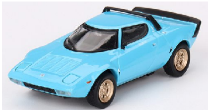
MGT00624-L Lancia Stratos HF Stradale 1975 blau