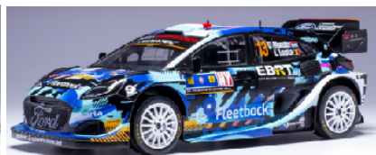
18CMC179 Renault 11 Turbo (1987) Custom Tuning schwarz € 72,50 18RMC187 Ford Puma Rally 1 # 8 WRC Central European Rally 2023 O.Tanak/M.Jarveoja € 74,95 18RMC188 Ford Puma Rally 1 # 13 WRC Central European Rally 2023 G.Munster/L.Louka € 74,95