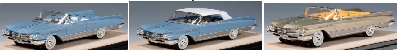
STM603003 Buick Electra 225 Convertible 1960 offen türkis metallic