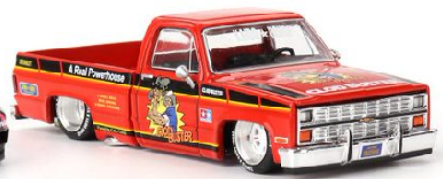
KHMG130 Chevrolet Silverado Tamiya X Kaido House "Clod Buster" 1980