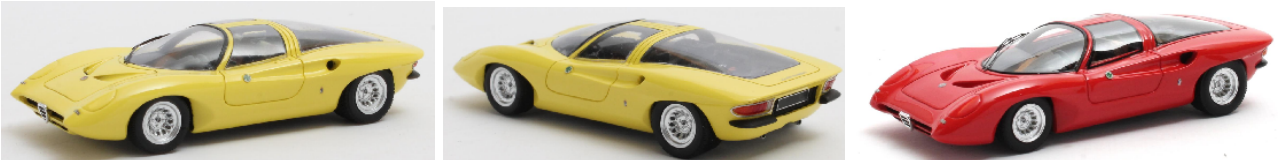
MX50102-151 Alfa Romeo 33.2 Coupe Speciale Pininfarina 1969 gelb