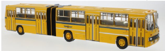
PCL 47164 Tatra 815 V26 Pritsche / Plane orange PCL 47163 Tatra 815 V26 Pritschen LKW weiß PCL 47192 Ikarus 280.33 Leipziger Verkehrsbetriebe