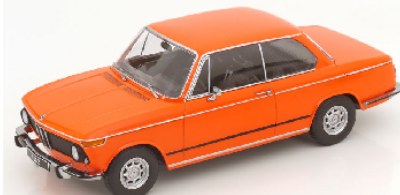
KKDC181144 BMW 1502 2.Serie 1974 orange (eckige Rückleuchten)