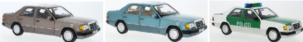
NOR 124231 Mercedes-Benz 230 E (W124) (1989-1993) Limousine dunkelbeige metallic