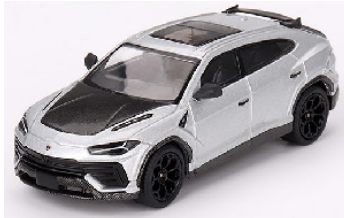
MGT00747-L Lamborghini Urus Performante 2024 grau