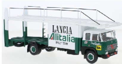
CLC538 Ford Escort MK II RS 1800 (1976) hellbeige € 27,50 TRU038 Fiat 673 Renntransporter LANCIA ALITALIA 1976 grün / weiß € 64,95