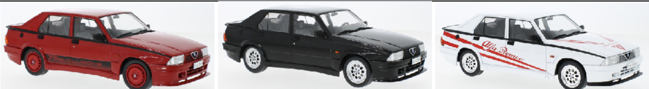
MCG 18428 Alfa Romeo 75 Turbo Evoluzione 1987 rot