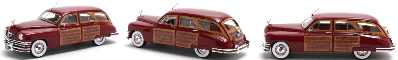
MX21601-063 Packard Eight Station Sedan 1948 rot