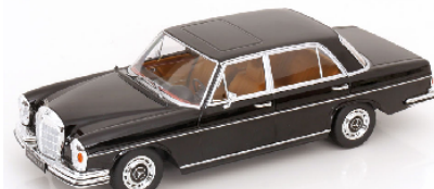
KKDC181211 Mercedes 300 SEL 6.3 W109 (1967-1972) schwarz