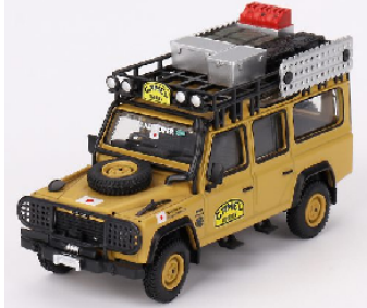
MGT00751-L Land Rover Defender 110 Amazon Team Japan Camel Trophy 1989