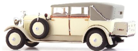
ATC 01021 Skoda Hispano Suiza 25/100PS Cabriolet (CZ, 1928) beige