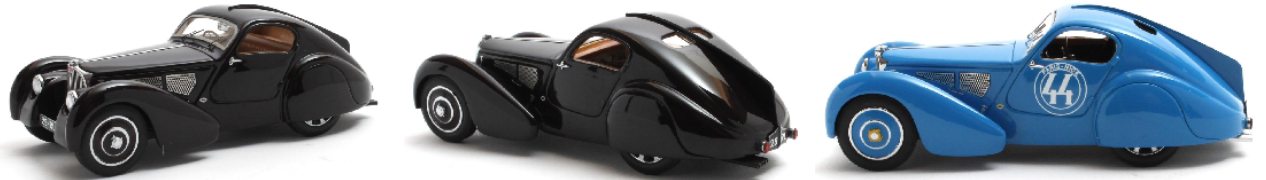
MX40205-042 Bugatti T51 Dubos Coupe 1931 schwarz