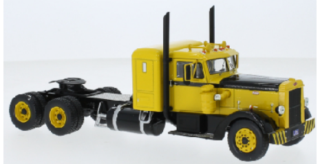
TR189 Freightliner Cascadia (2018) gold metallic € 35,95 TR191 Mack Serie F (1977) braun € 35,95 TR192 Peterbilt 350 (1952) gelb/schwarz € 35,95