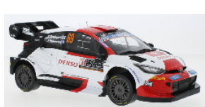
18RMC161A Audi Sport quattro S1 # 4 1000 Seen Rallye 1985 S. Blomqvist / B. Cederberg € 74,95 18RMC161B Audi Sport quattro S1 # 6 1000 Seen Rallye 1985 H. Mikkola / A. Hertz € 74,95 18RMC152A Toyota GR Yaris # 17 Rallye Monte Carlo 2023 S.Ogier/V.Landais € 74,95 18RMC152B Toyota GR Yaris # 69 Rallye Monte Carlo 2023 K.Rovanperä/J.Halttunen € 74,95