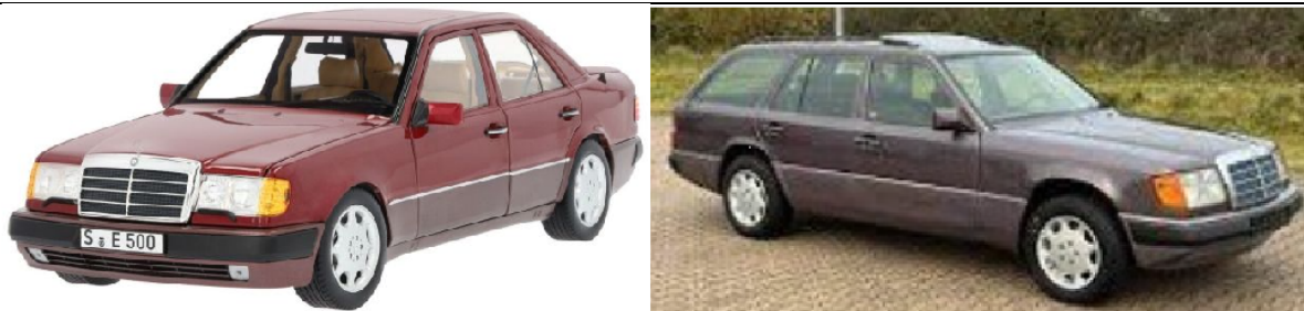
NOR 124500 Mercedes-Benz 500 E (W124) almandinrot metallic