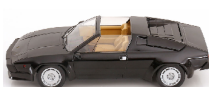
KKDC181284 Lamborghini Jalpa 3500 1982 schwarz (bekannt aus TV und Kino)