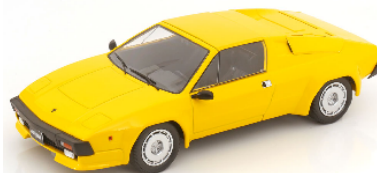
KKDC181283 Lamborghini Jalpa 3500 1982 gelb