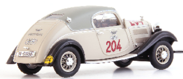
ATC 07032 Wanderer W22 "2000km durch Deutschland" (D, 1933) hellgrau