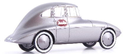
ATC 04041 Audi Typ K Stromlinie Paul Jaray (Deutschland 1923)