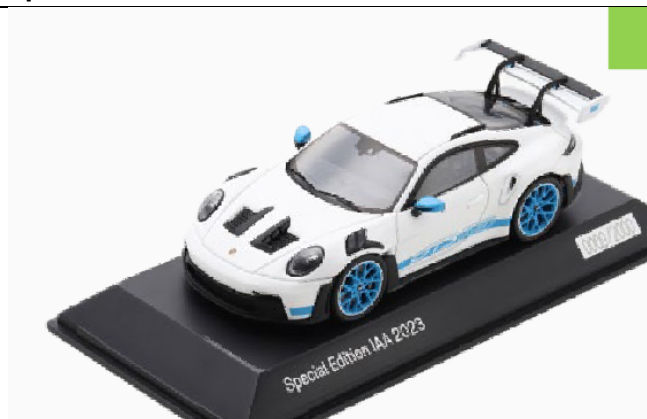
SPA 0200610S Porsche 911 (992) GT3 RS weiß blau, Sondermodell IAA 2023, limitiert auf 2.000 Stück € 84,95