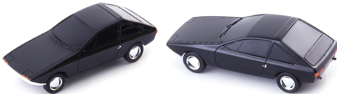
ATC 06058 Renault Ligne Flèche (Frankreich 1963)