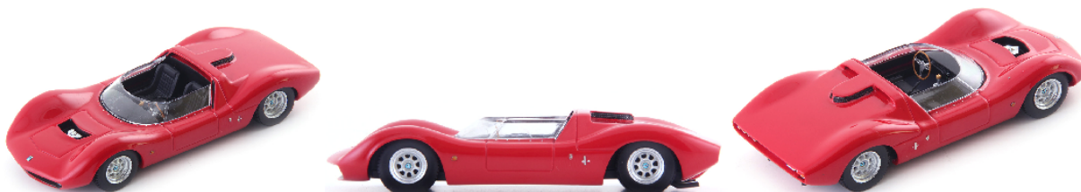
AV 60103 De Tomaso Competizione 2000 (Italien 1965) rot

Boyers Entwurf fand sich letztlich im Renault 12 wieder.