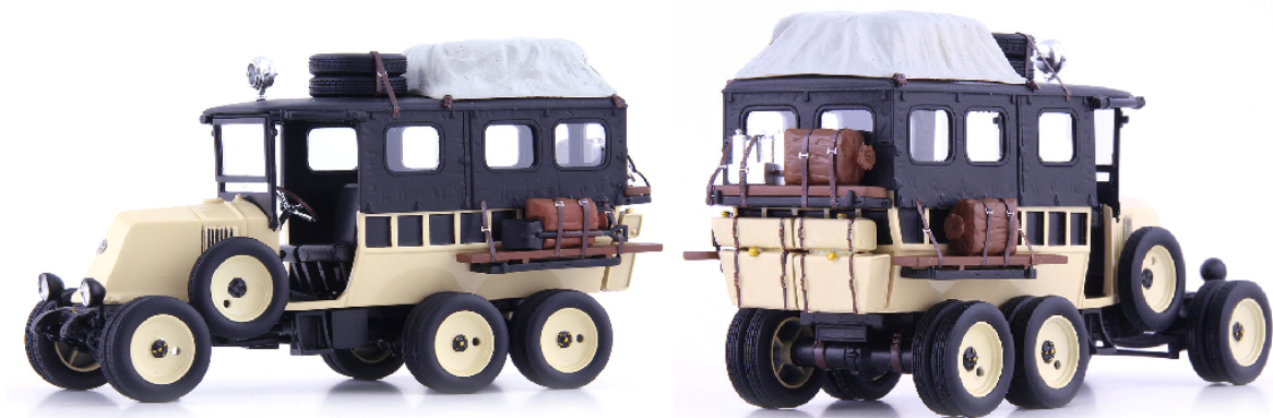
ATC 11016 Renault Type MH 6 Roues (Frankreich 1924)