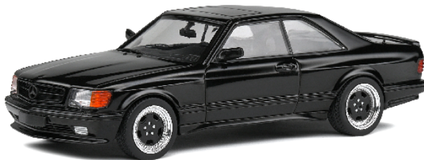
42 143 6740 Mercedes 560 SEC AMG Breitbau 1990 schwarz 42 143 6750 Mercedes 560 SEC AMG Breitbau 1990 rot

Die Qualität der jetzt lieferbaren Solido Modelle im Maßstab 1:43 gefällt nicht nur uns sondern auch vielen Kunden und das Preis / Leistungsverhältnis ist sehr gut. Hier die Auflistung der derzeit lieferbaren Modelle.