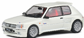
42 143 6880 Peugeot 205 GTI Dimma 1986 weiß 42 143 6820 BMW M5 E39 blau 42 143 6830 BMW M5 E39 silber