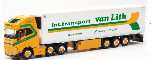
315456 Volvo FH Globetrotter XL 6x2 (2020) Kühlkoffer-Sattelzug "Van Lith" (NL) € 48,95 315401 MAN TGX GX Koffer-Sattelzug mit 15m Auflieger "Schütte Kühllogistik" € 44,95