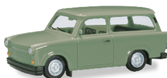
027359-004 Trabant 1.1 Universal blassgrün