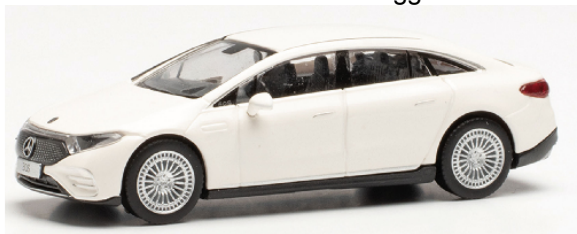
421041 Mercedes EQS AMG Line polarweiß