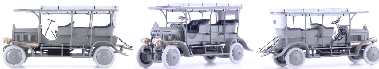
ATC 01017 Daimler Dernburg-Wagen (Deutschland 1907)