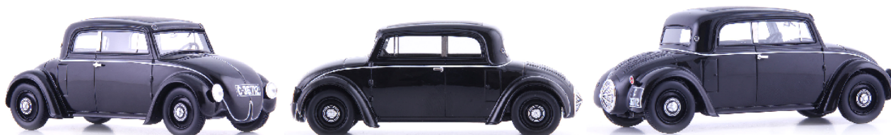
ATC 06052 Skoda 932 (CZ, 1932)

Die Zuständigkeit für die Konstruktion des Wagens wurde in die Hände von Paul Daimler gelegt - dem Sohn des Firmengründers Gottlieb Daimlers. Im Werk in Berlin-Marienfelde machte sich die Technikercrew sofort daran, die Wünsche des Kolonialamtes in Form eines Lastwagens zu erfüllen, der auf Basis eines serienmäßigen Chassis aufgebaut wurde. Für den über vier Meter langen und 3,6 Tonnen schweren Sonderwagen stellte die Daimler-Motor-Gesellschaft dem Kolonialamt den Betrag von 34.750 Mark in Rechnung. Durch eine ausführliche, 1.677 km dauernde Dauertestfahrt auf heimischen Boden im Frühjahr 1908 zeigten sich alle Herren zufrieden und im Mai 1908 wurde das Fahrzeug auf das Dampfschiff 'Kedive' verladen - mit Bestimmungsort Swakopmund in Deutsch-Südwestafrika. Zusammen mit dem Auto begab sich auch der von der Daimler-Motoren-Gesellschaft zur Verfügung gestellte Paul Ritter mit auf den Weg, der seine Aufgabe zwar in erster Linie als Chauffeur sah, aber auch für die Wartung und die Instandsetzung verantwortlich war. In Begleitung weiterer Fahrzeuge von Daimler und Benz setzte sich der Tross mit Bernhard Dernburg im heutigen Namibia zur Erkundung der deutschen Kolonie in Bewegung. Das Lob für den im Sprachgebrauch schnell als Dernburg-Wagen bekanntgewordenen Lastwagen kam in Form einer immensen Zeitersparnis zum Ausdruck, denn für eine 600 km lange Fahrstrecke benötigte die Autokolonne vier Tage, während die gleiche Strecke zu Pferd neun Tage beanspruchte.