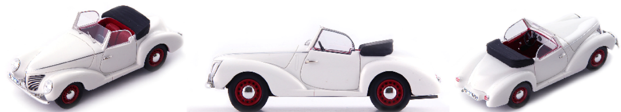
A43 060084 Aero Pony P750 1941