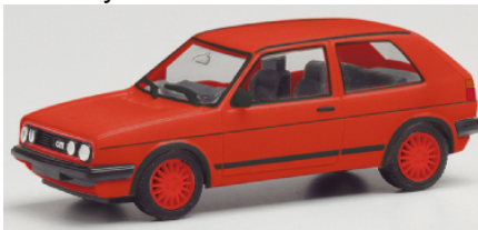
420846-002 VW Golf II GTI mit Sportfelgen rot