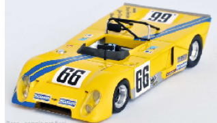
Deco - sample not final