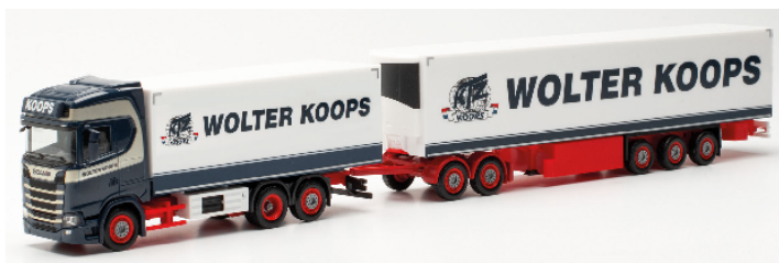
315487 Scania CS 20 Highline Eurocombi "Wolter Koops" (NL) € 49,95 315463 Volvo FH Globetrotter (2020) Schubboden-Sattelzug "van Deuveren" (NL) € 44,95