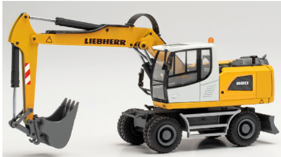
314442 Liebherr Mobilbagger A 920 Litronic "Liebherr"