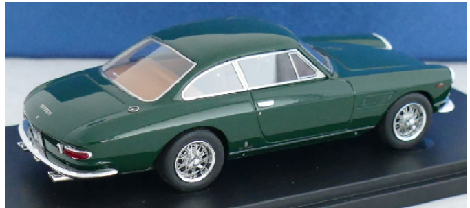
ATC90198 Ferrari 330 GT 2+2 "Enzo Ferrari's Privatwagen"