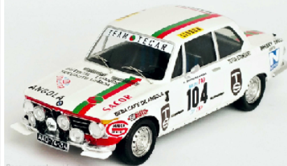
Deco - sample not final

Ford Escort MK I # 36 Donegal International Rallye 1975 B. Fischer / D. Smyth € 71,50