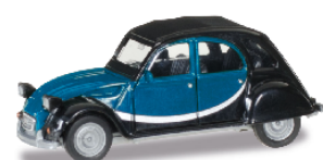
020817-006 Citroën 2 CV Charleston schwarz / blau