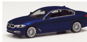
430692-004 BMW 5er Limousine (G30) tansanitblau metallic