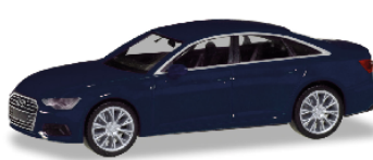
430630-003 Audi A6 Limousine (C8) firmamentblau metallic