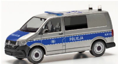
097109 VW T6.1 Kombi "Policija" (PL)