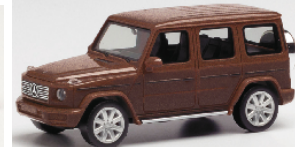
430623-004 Mercedes-Benz G-Klasse (2018) mysticbraun metallic