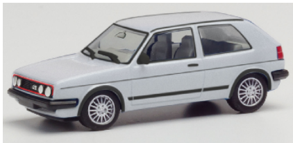
430838-002 VW Golf II GTI mit Sportfelgen silber metallic