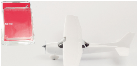
013789-002 Minikit Sportflugzeug (Cessna 172) weiß mit silbernem Propeller