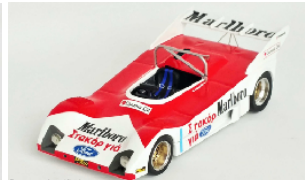
Deco - sample not final