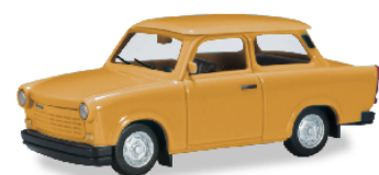
027342-004 Trabant 1.1 Limousine honiggelb