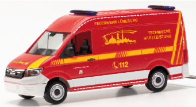
097093 MAN TGE Kastenwagen mit Hochdach "Feuerwehr Lüneburg"