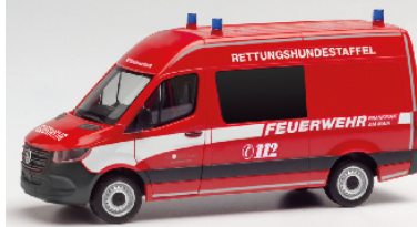
096881 Mercedes Sprinter (2018) Halbbus mit Hochdach "FW Frankfurt / Rettungshundestaffel"