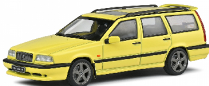
42 143 6840 Volvo 850 T5-R Kombi 1994 gelb 42 143 6850 Volvo 850 T5-R Kombi 1994 grün metallic 42 143 6890 Peugeot 205 GTI Dimma 1986 schwarz