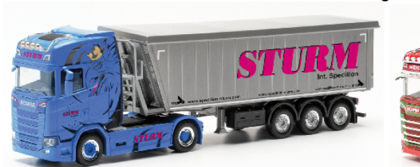
315234 Scania CS20 Normaldach Stöffelliner-Sattelzug "Sturm" € 44,95 315425 Scania CS 20 Highline Volumen-Hängerzug "Spedition Wehle" € 49,95