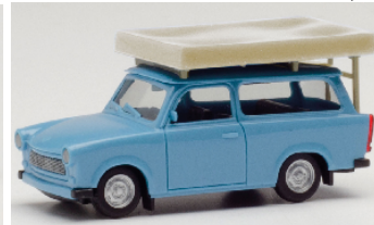
024181-003 Trabant 601 S Universal mit Dachzelt (Fahrzustand) pastellblau