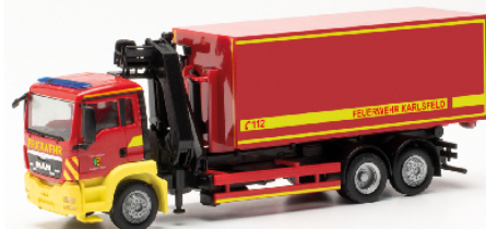
096775 MAN TGS M Wechsellader-LKW mit Kran "Feuerwehr Karlsfeld"