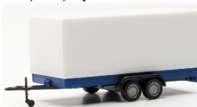
055437 PKW Tandem-Anhänger mit Plane blau / weiß