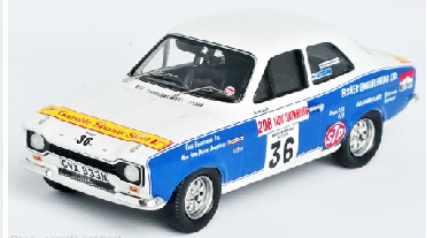
Deco - sample not final