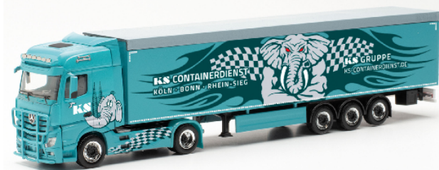
315241 Mercedes Actros (2018) Bigspace Schubboden-Sattelzug "KS Containerdienst" € 46,95 315586 Scania CS 20 Highline Kühlkoffer-Sattelzug "Spring" (CH) € 49,95