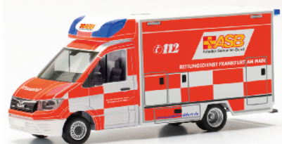
096898 MAN TGE Fahrtec RTW "ASB Frankfurt"