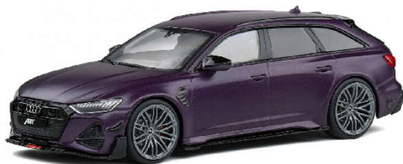
42 143 6860 ABT Audi RS6-R purple matt 42 143 6870 ABT Audi RS6-R daytona grau