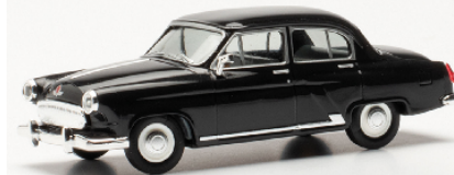
023283-002 Wolga M21 Limousine schwarz