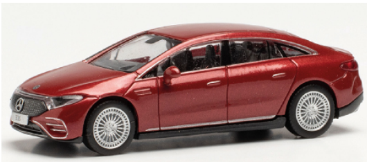
430944 Mercedes EQS AMG Line hyazinthrot metallic