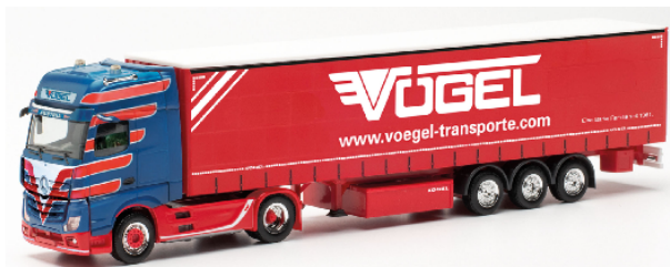
315418 Mercedes Actros (2018) Gigaspace Gardinenplanen-Sattelzug "Vögel" (A) € 46,95 315197 Iveco S-Way Active Space Gardinenplanen-Szg. "Magirus Edition/Müller-Pischa" € 49,95