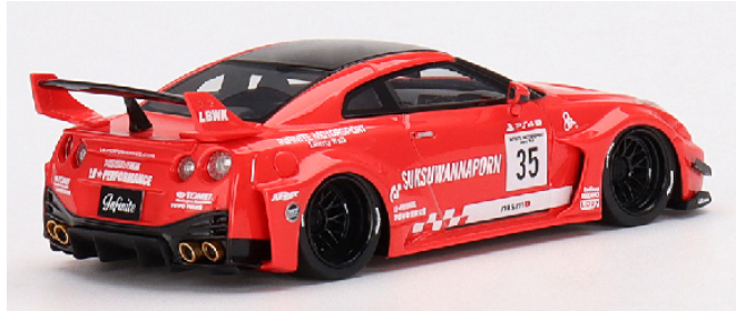
TSM V0010 LB-Silhouette WORKS GT NISSAN 35GT-RR Ver.1 rot / schwarz LBWK