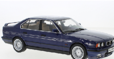
Deco - sample not final