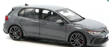
188590 VW Golf GTI 2020 grau