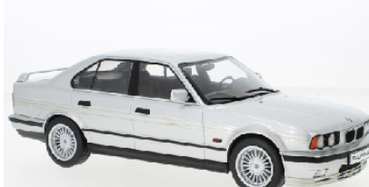
Deco - sample not final