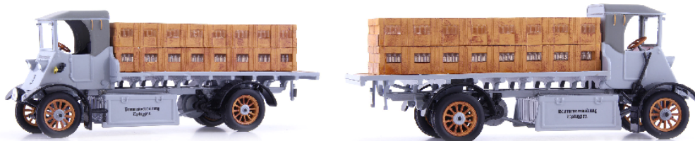
ATC 11015 Tribelhorn 3to Kettenwagen (Schweiz 1918)