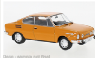
Deco - sample not final