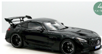
183900 Mercedes-AMG GT Black Series 2021 schwarz