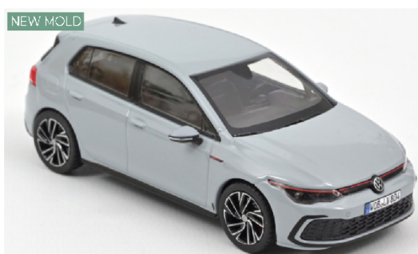
840137 VW Golf GTI 2020 grau