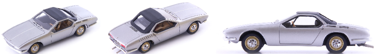
AV 60083 Karmann Ghia Typ 1 Prototyp (Deutschland 1965) silber metallic