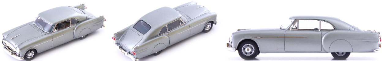
AV 60079 Packard Parisian Coupe (USA 1952) hellgrün-grau