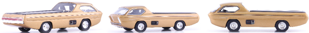
ATC 08018 Dodge Deora (USA 1967)