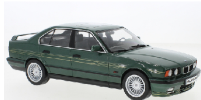
Deco - sample not final