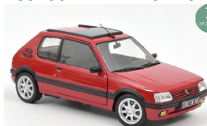
184848 Peugeot 205 GTi 1.9 PTS Rims 1991 rot