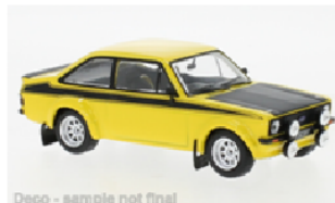
Deco - sample not final