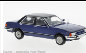
Deco - sample not final