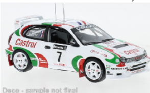
Deco - sample not final