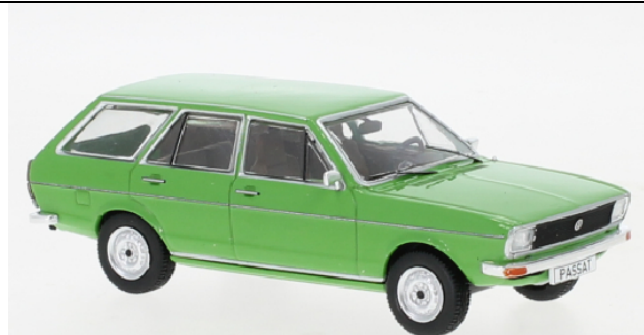
Deco - sample not final