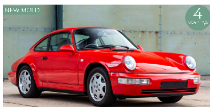
187320 Porsche 911 (964) Carrera 2 1990 rot