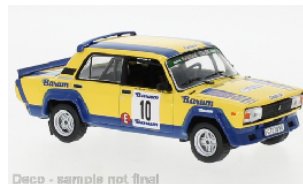
Deco - sample not final