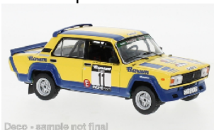
Deco - sample not final