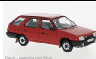
Deco - sample not final